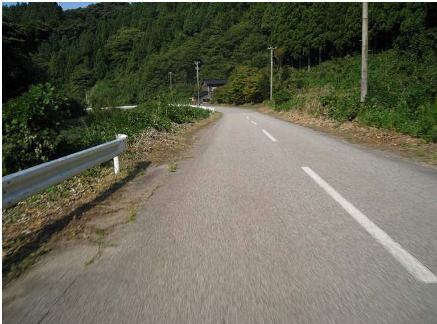
48. 川沿い その2