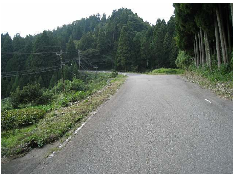
20. 上り その16