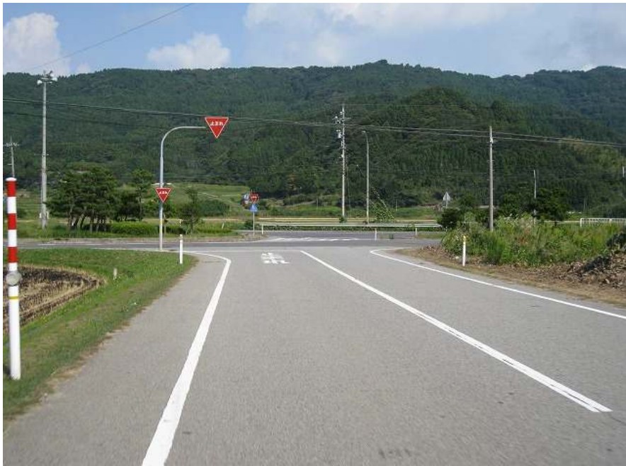
72. スーパー農道 その18 国道交差点 標高10m