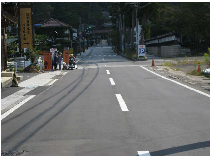
79. ゴール 全力で駆け抜けよう！