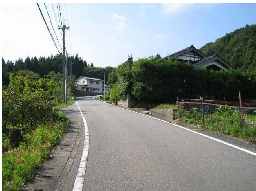
5. 上り その2