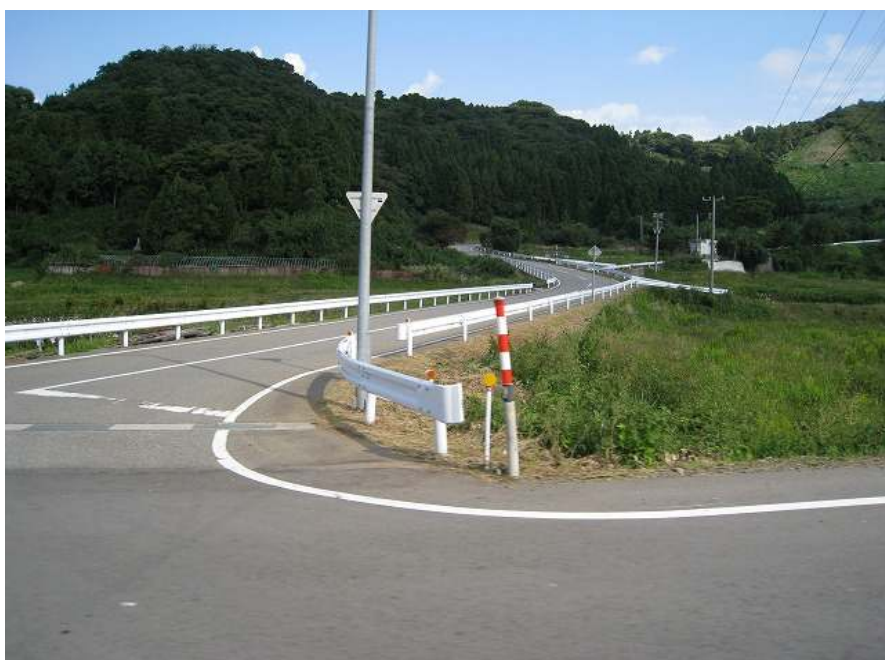
54. 千代 スーパー農道入り口 標高33m