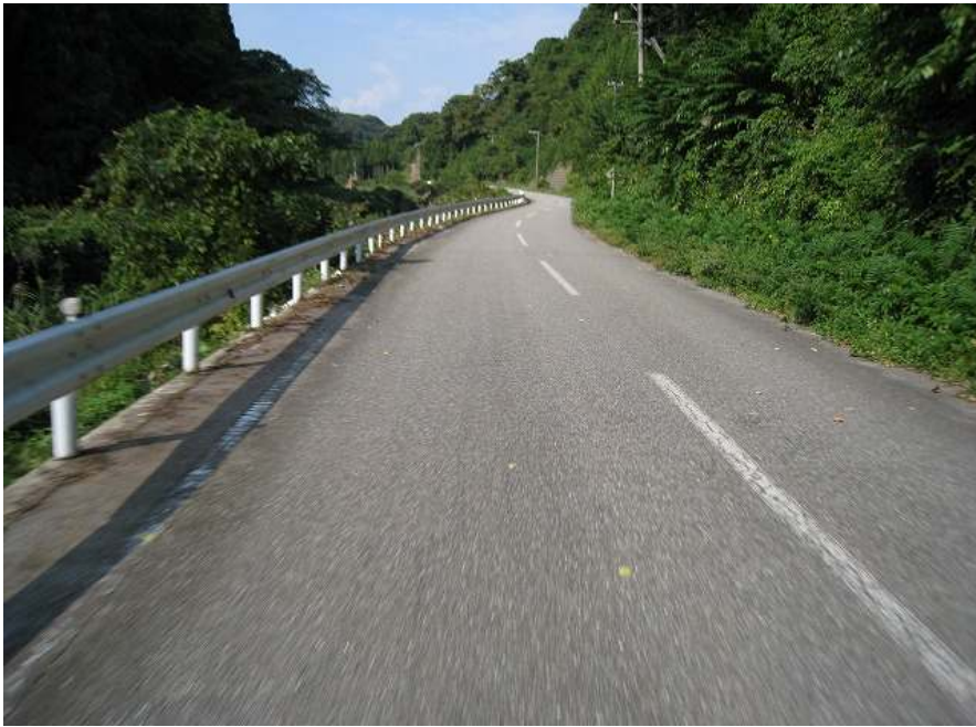
50. 川沿い その4