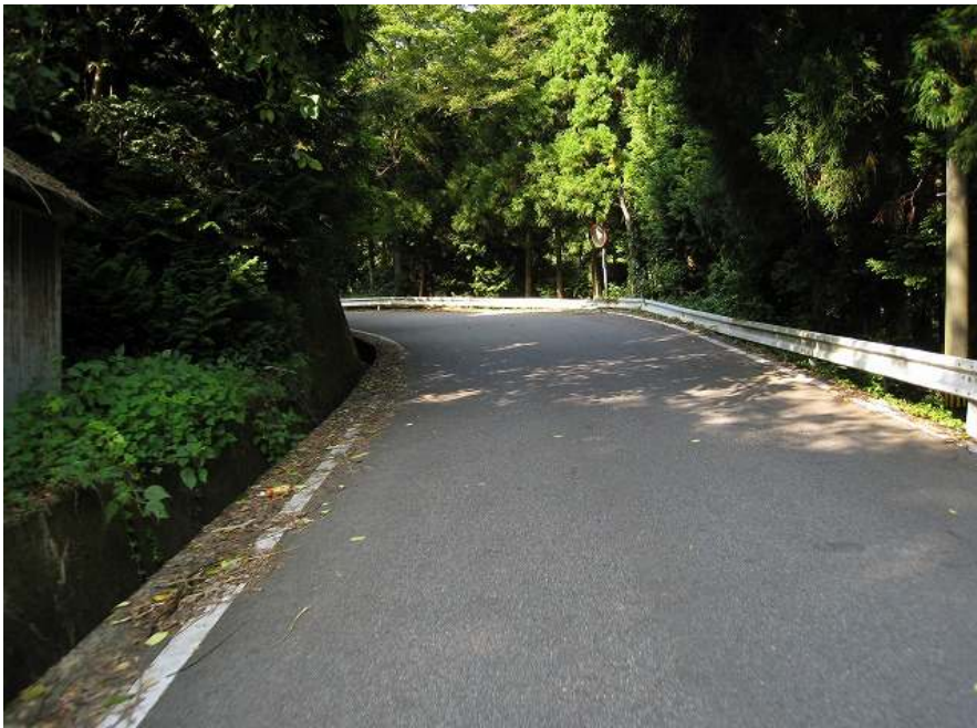
8. 上り その5 標高71m 勾配めっちゃきつい