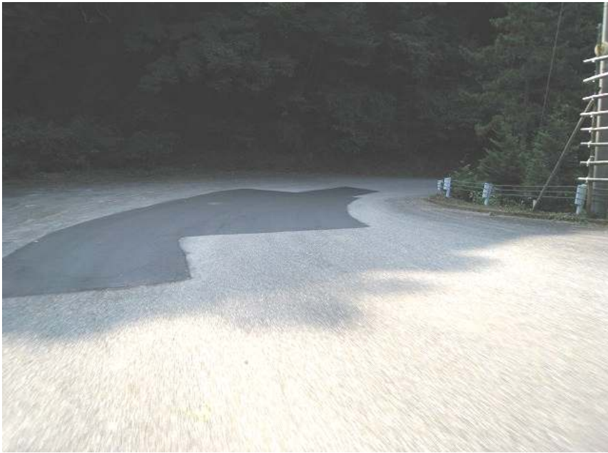
33. 下り その6 いやらしいS字コーナー