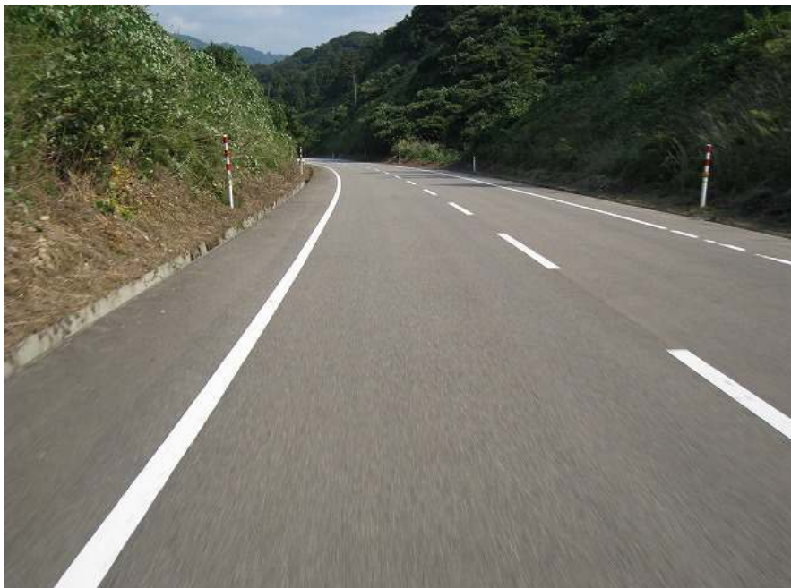
68. スーパー農道 その14