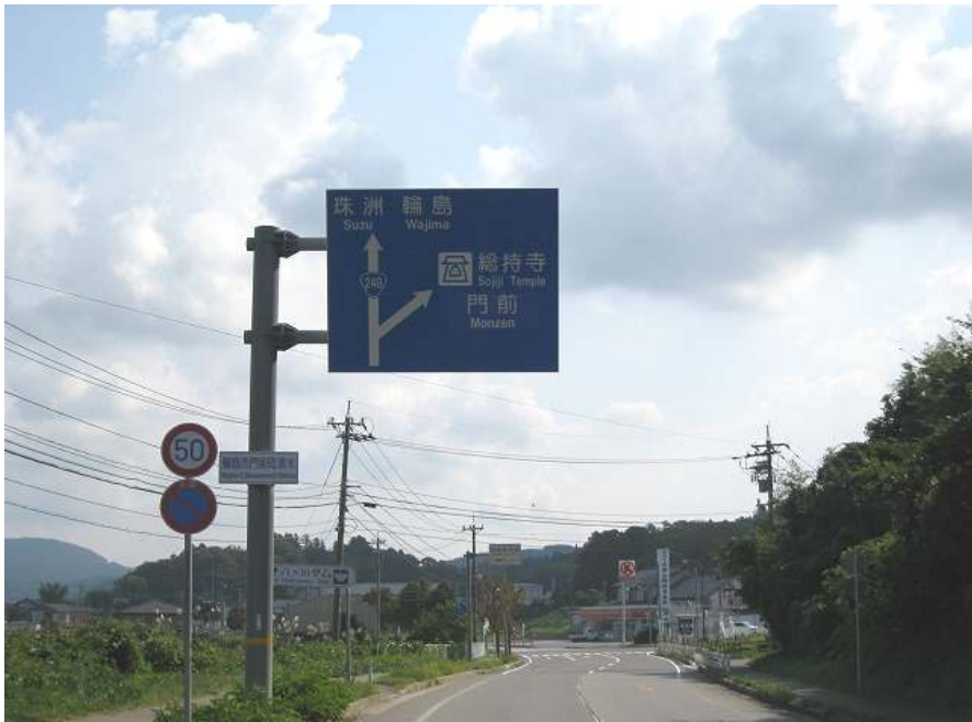
75. 国道249 その3