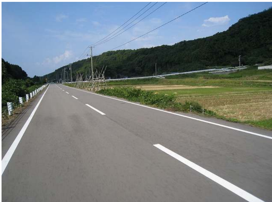
53. 川沿い その7