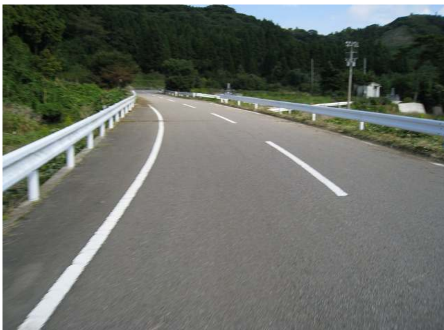
55. スーパー農道 その1 入口の勾配はきつい