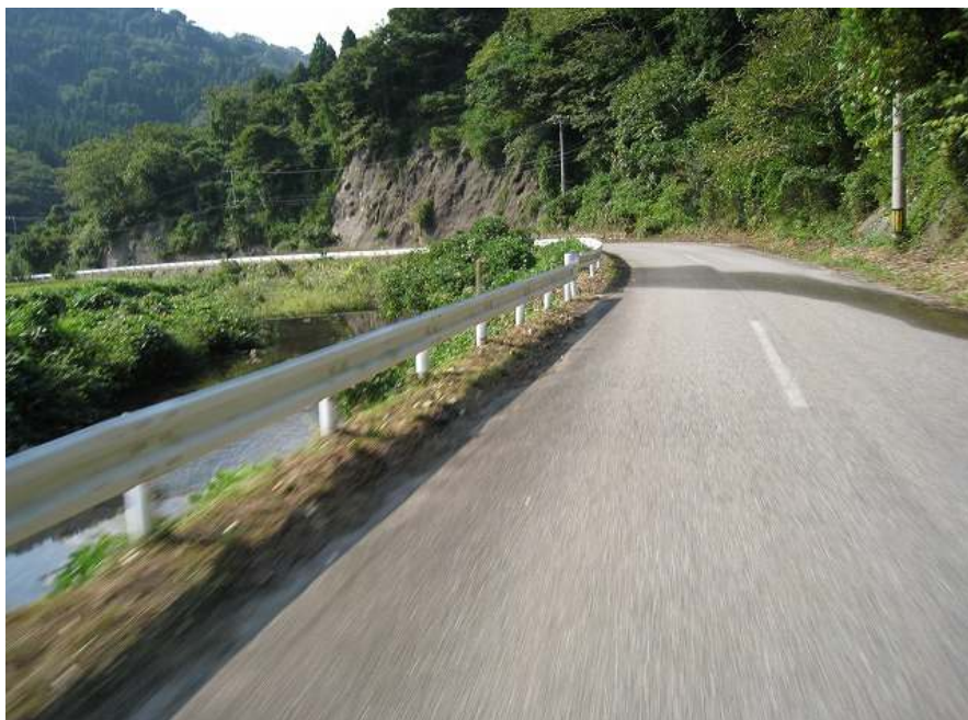
49. 川沿い その3