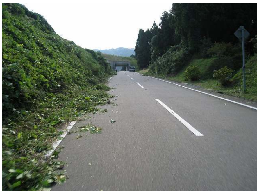
58. スーパー農道 その4 トンネルまで勾配はきつい