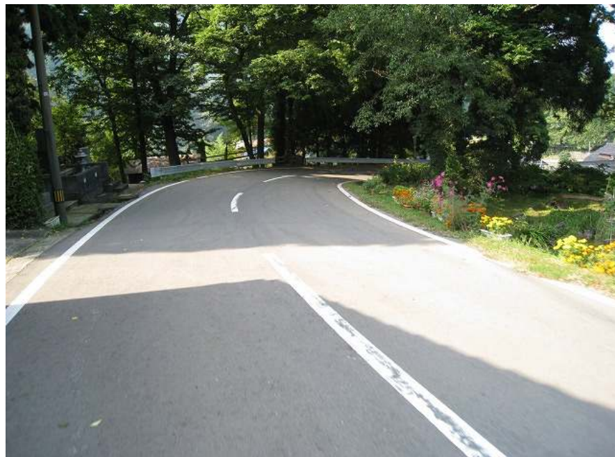
42. ポイント！ 猿橋の逆バンクコーナー