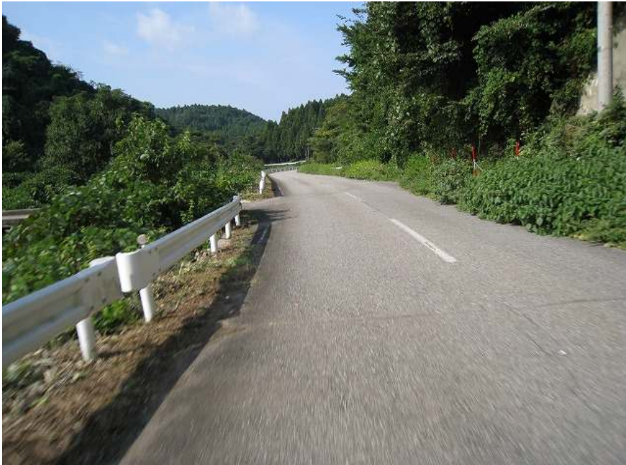
51. 川沿い その5