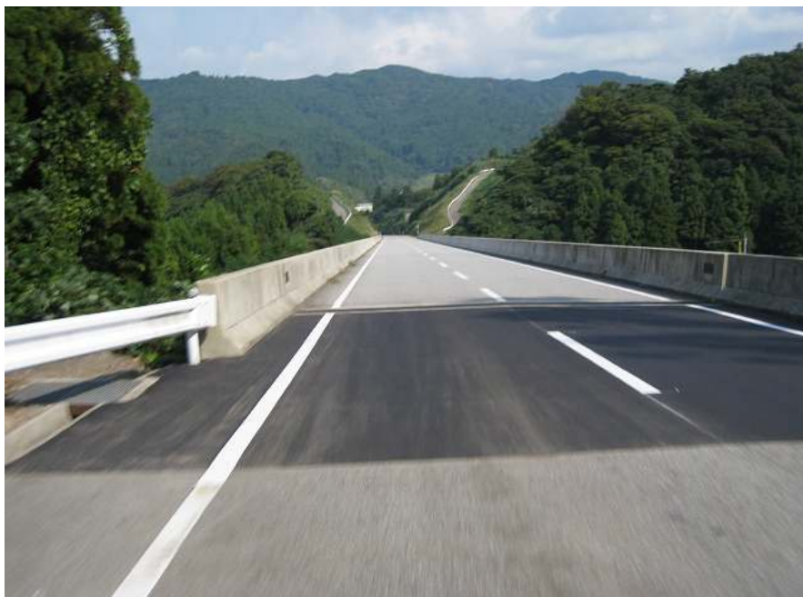
70. スーパー農道 その16 最もスピードが乗る跨道橋