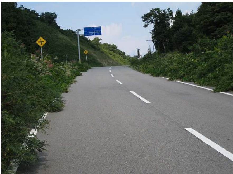
62. スーパー農道 その8 峠は近い