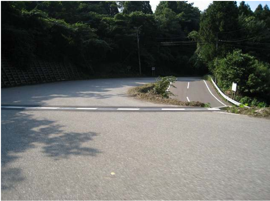
35. ポイント！ 小滝ヘアピンカーブ 上から