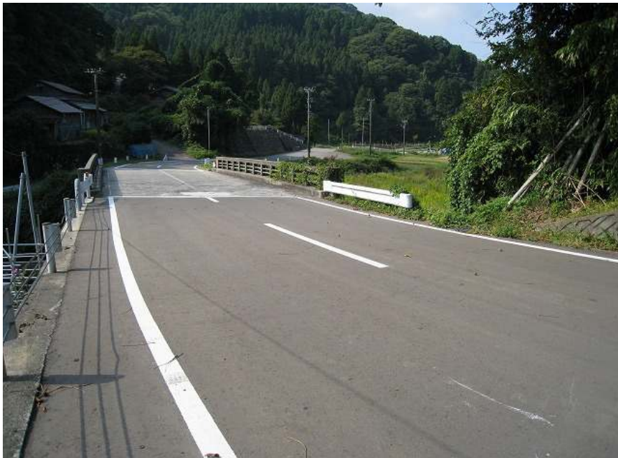
45. 下り その13 標高89m