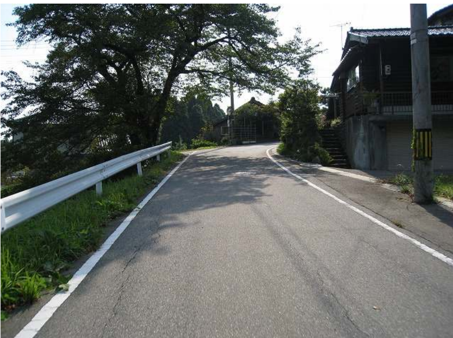
9. 上り その6