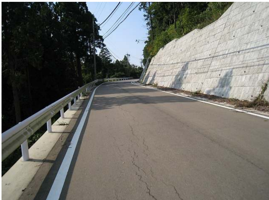
23. 上り その19