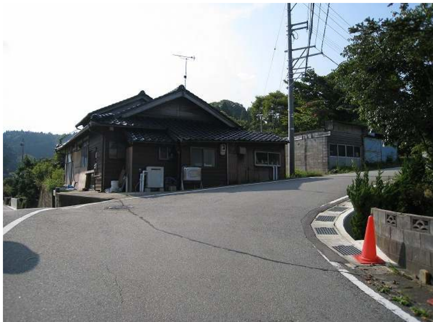
4. 上り その1 最初のコーナー 勾配かなりきつい