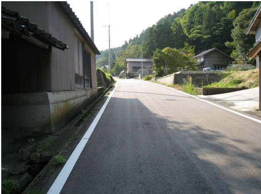
14. 上り その10 標高131m