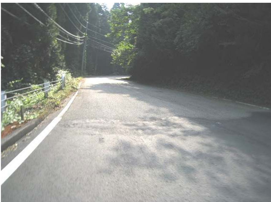
21. 上り その17 勾配めっちゃきつい