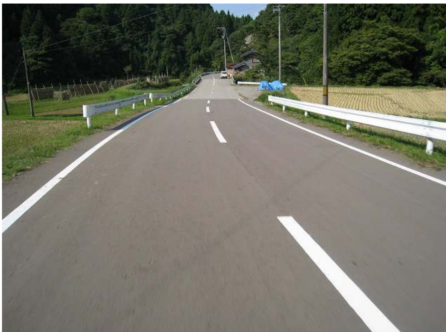
46. 下り その14