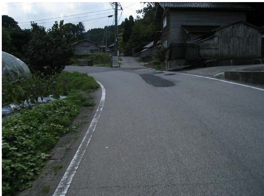
15. 上り その11 広岡