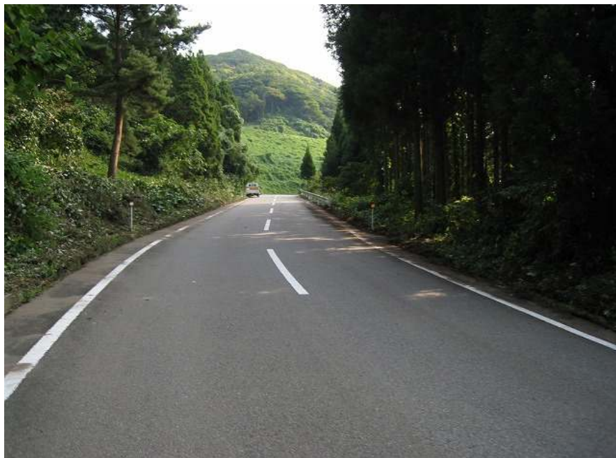
56. スーパー農道 その2