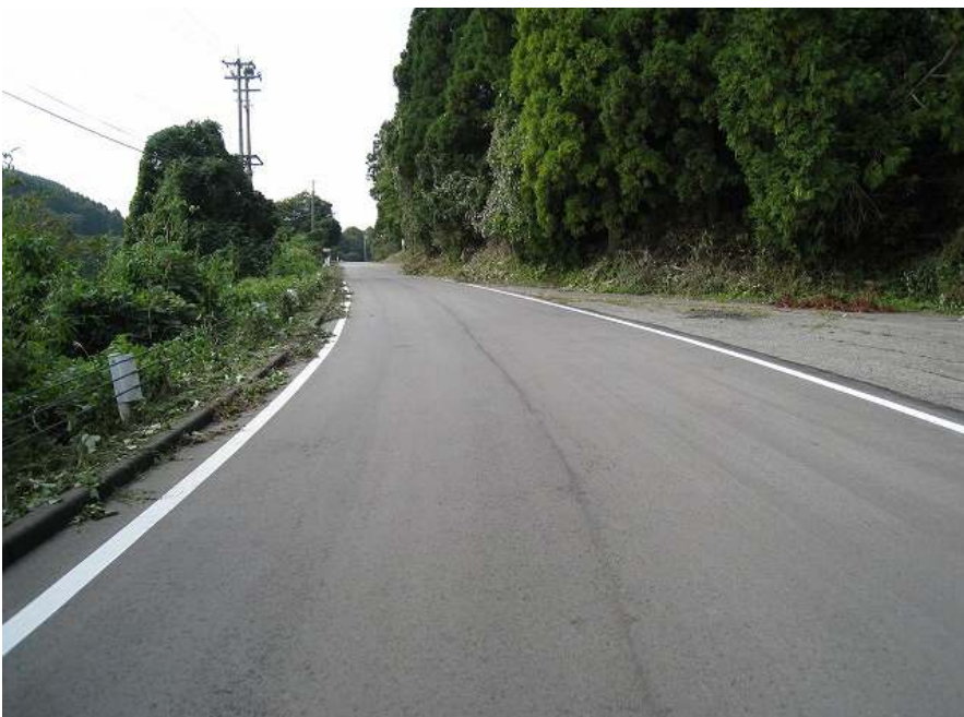
24. 上り その20 いよいよ峠も近い