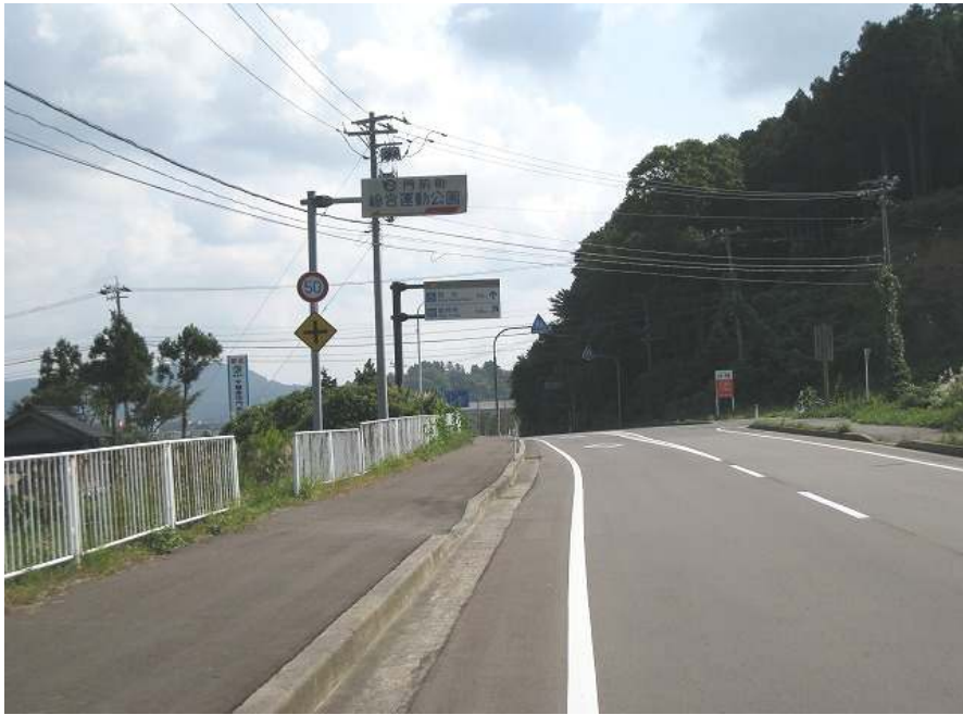
74. 国道249 その2 総持寺まで800m