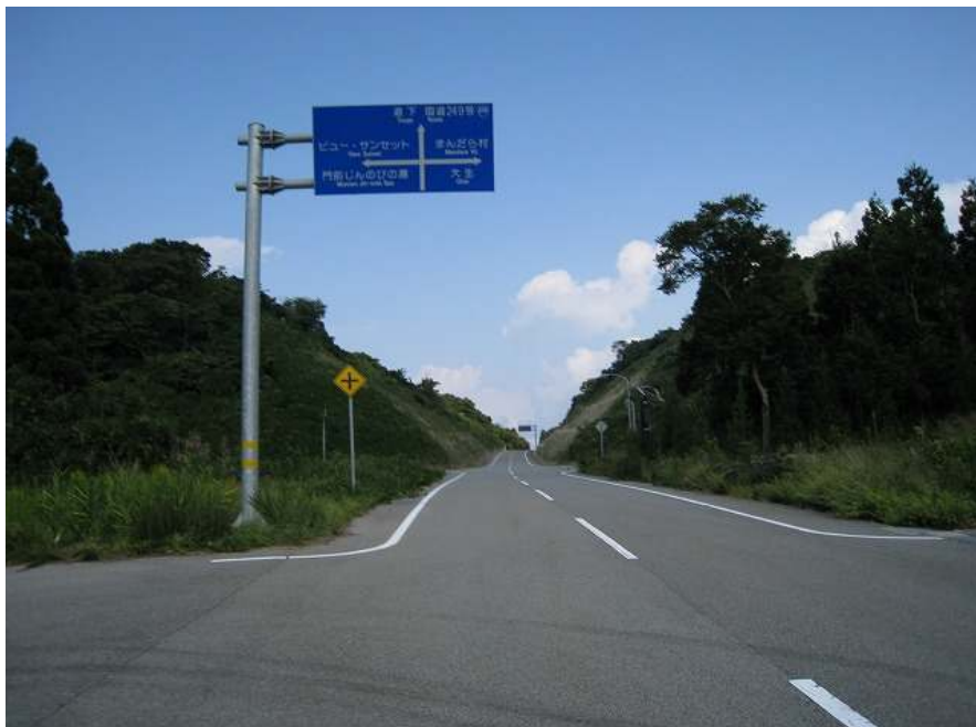
63. スーパー農道 その9 交差点 標高122m 一旦平坦になる