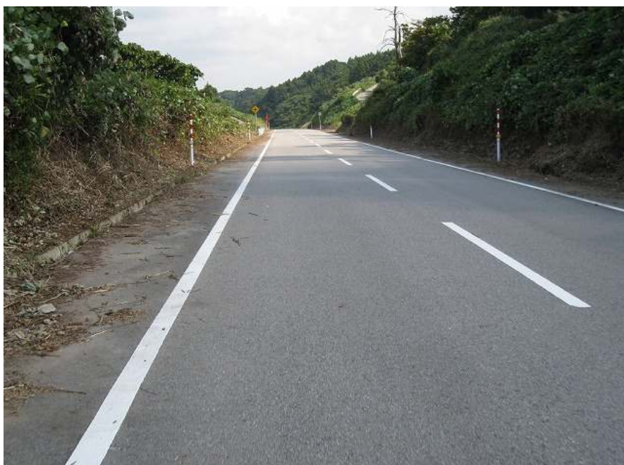
67. スーパー農道 その13 しばらく平坦になる 標高105m