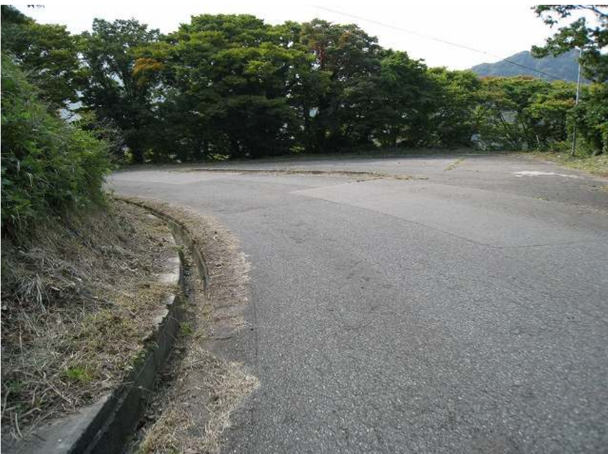
29. 下り その2 左コーナーはブラインド