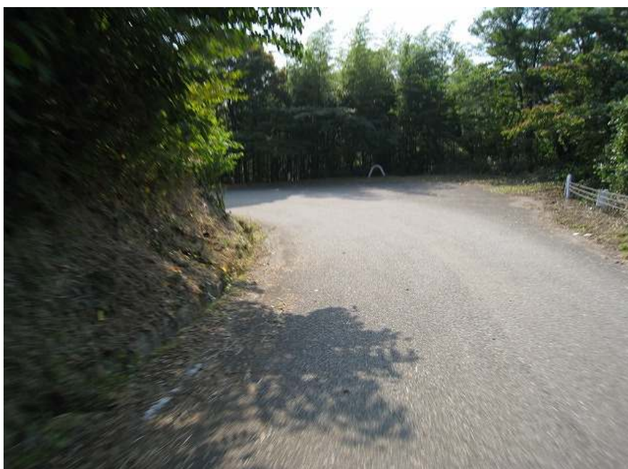
31. 下り その4 このコーナーかなりきつい