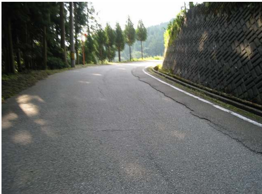
19. 上り その15 コンクリート壁を曲がるとしばらく平坦