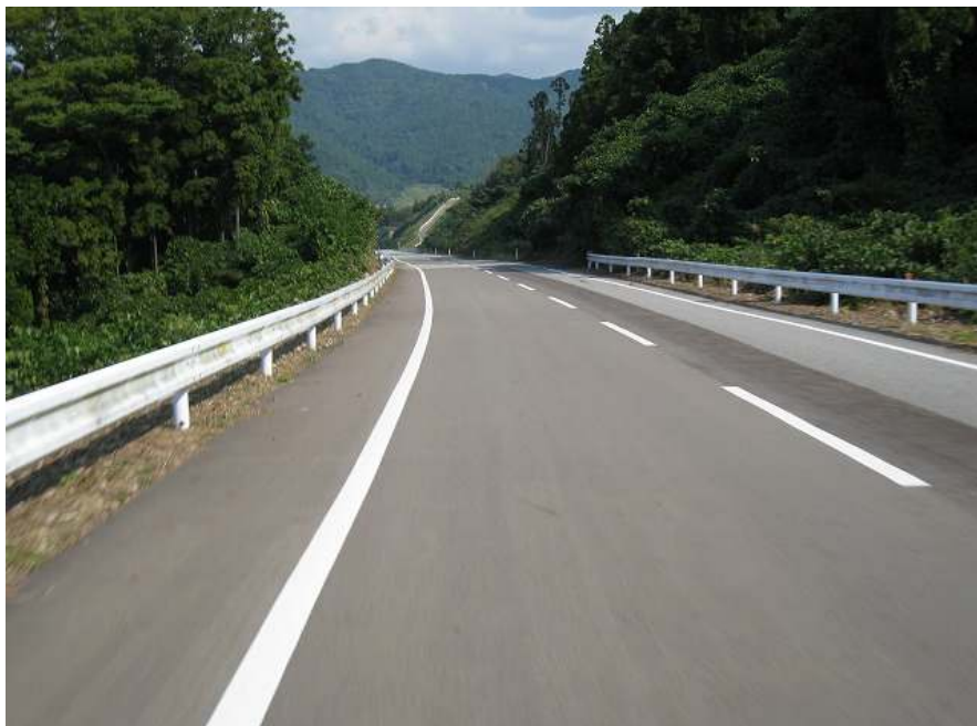
69. スーパー農道 その15