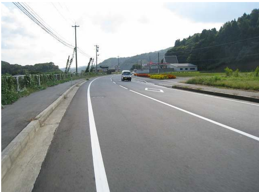
73. 国道249 その1