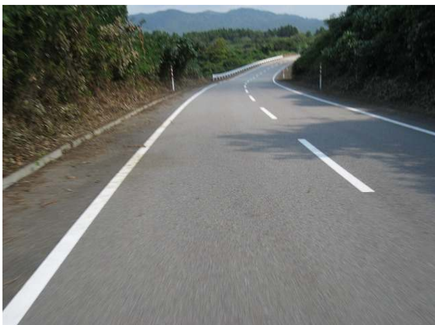
66. スーパー農道 その12