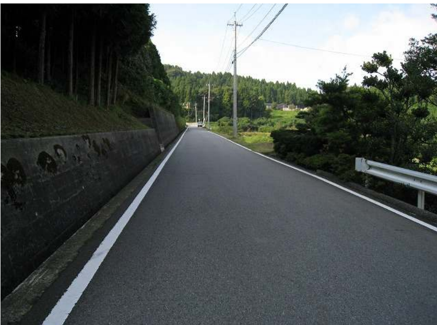
12. 上り その9 1kmはもうすぐ