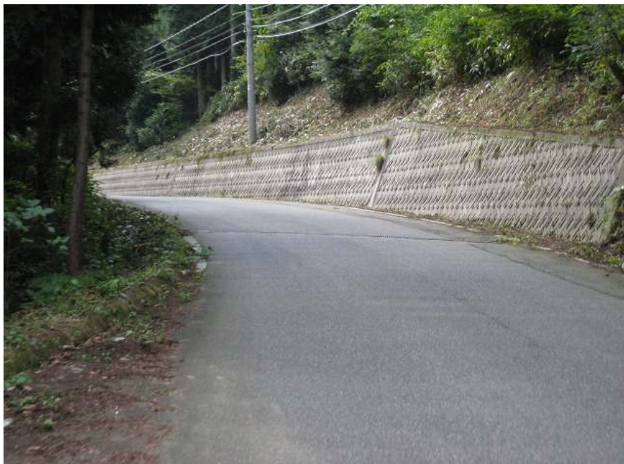
22. 上り その18