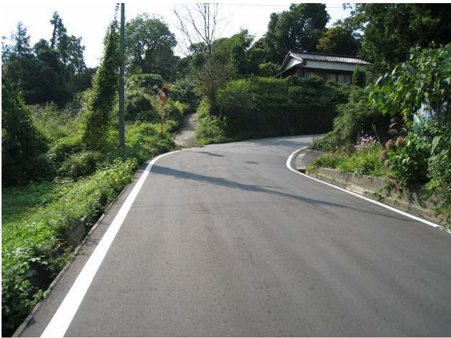
7. 上り その4