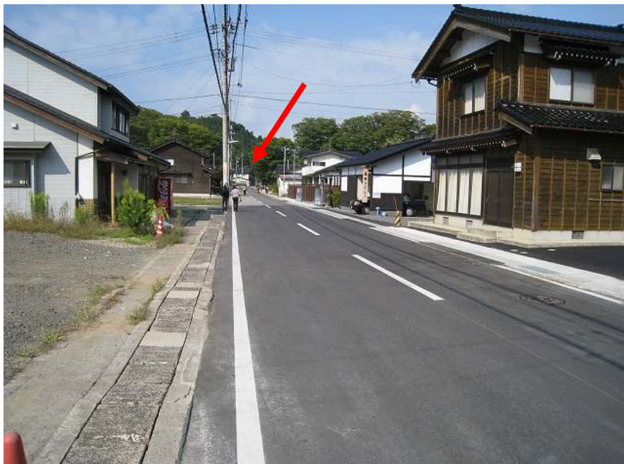
1. スタート地点 矢印の家手前から上りが始まる