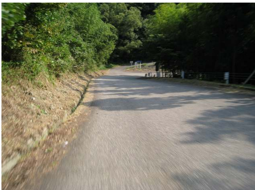
32. 下り その5 右へ下る 直進は古和秀水への道