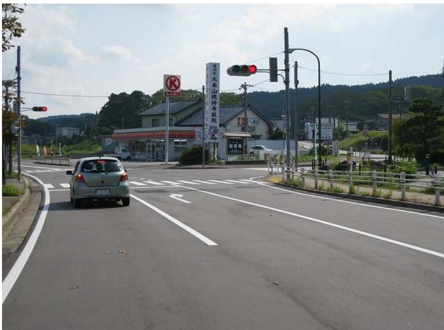
76. 国道249 その4 サークルK手前を右へ入る 路面荒れているので注意