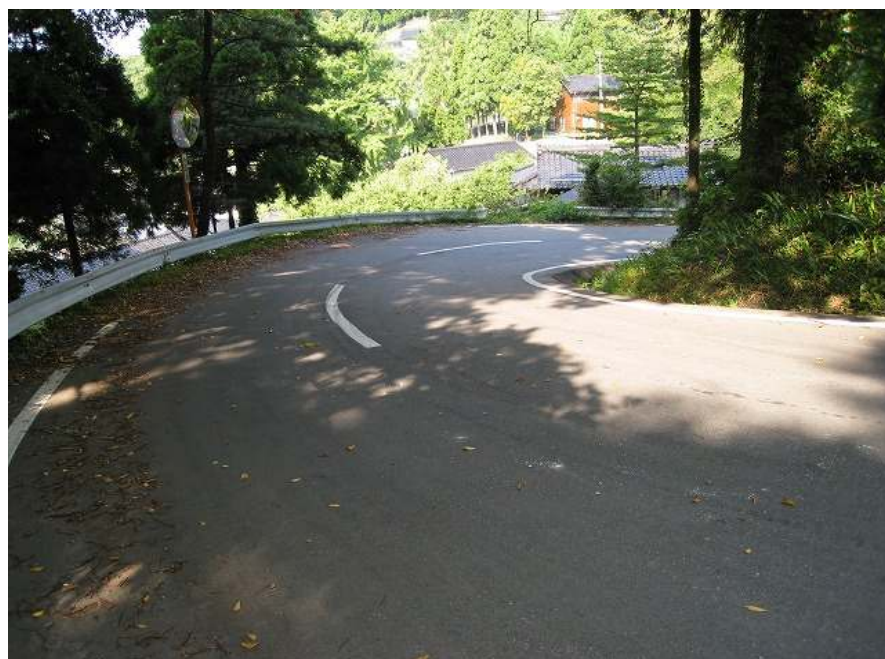
43. ポイント！ 猿橋の逆バンクコーナー アウト側は落ち葉がいっぱい