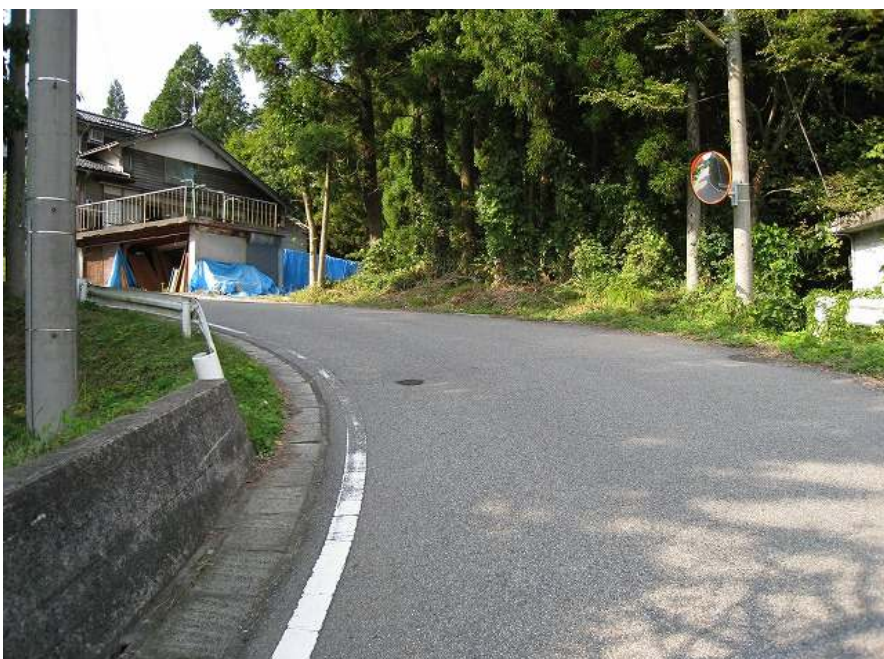
6. 上り その3 標高45m 勾配めっちゃきつい