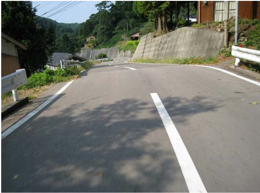
44. 下り その12 川沿いへの下り 最も飛ばせるところ