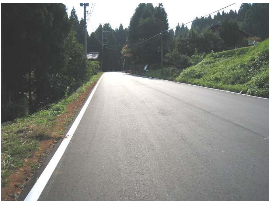
11. 上り その8 標高92m 勾配めっちゃきつい