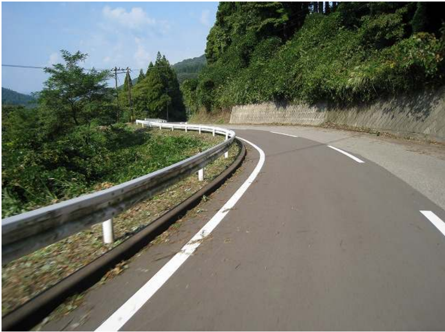
38. 下り その8