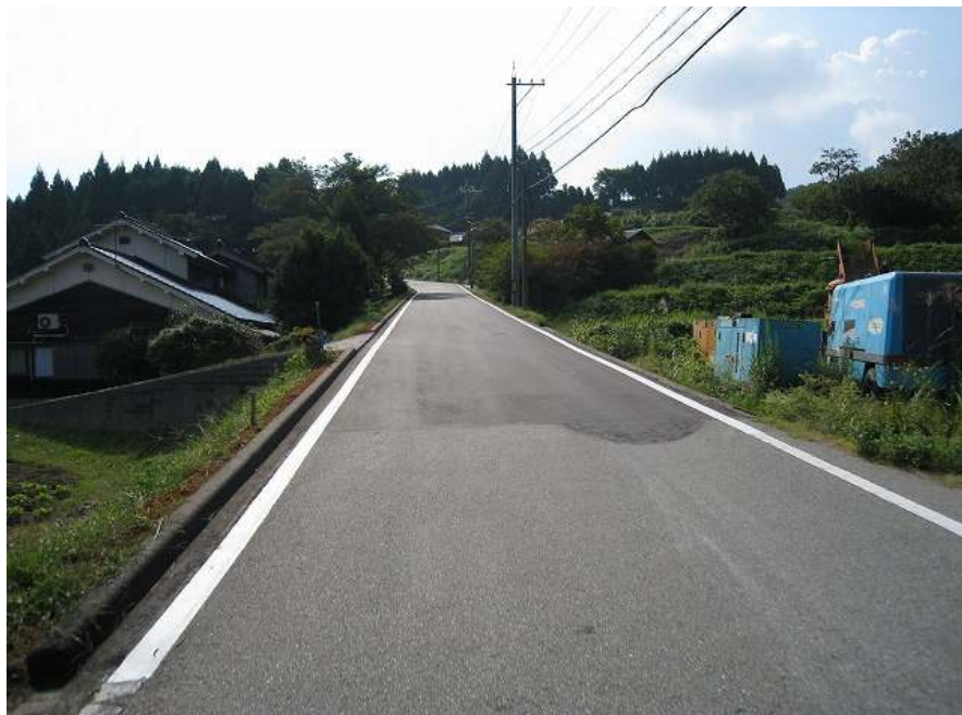
10. 上り その7 まっすぐの上り 1km付近の道が見える