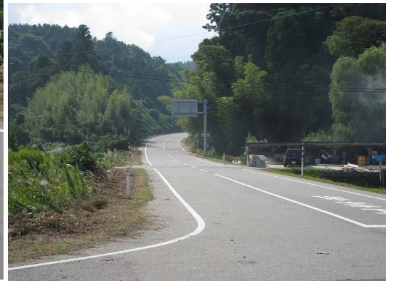
国道側からの眺め