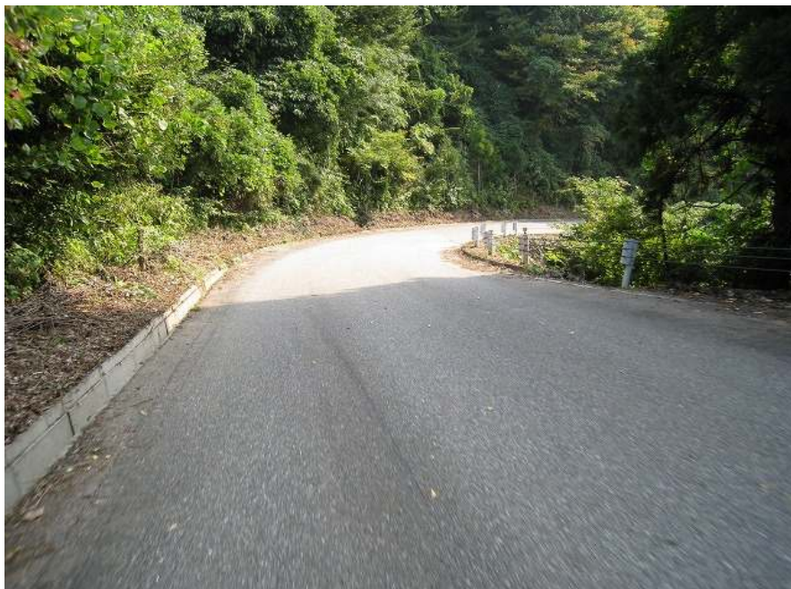
30. 下り その3