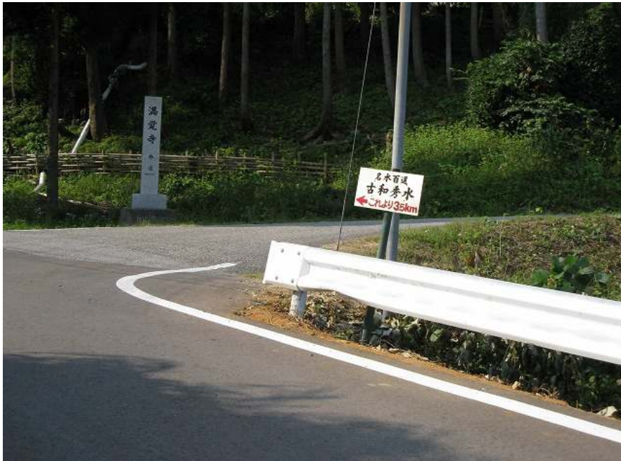
13. ポイント! 上り口から1km