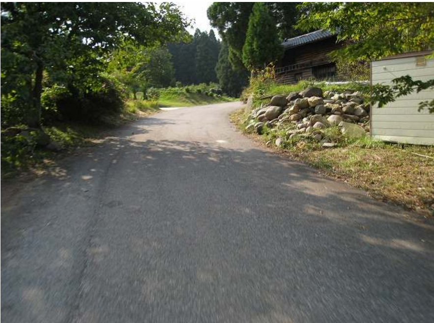
17. 上り その13