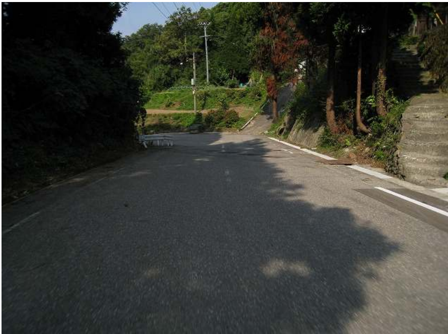
39. 下り その9