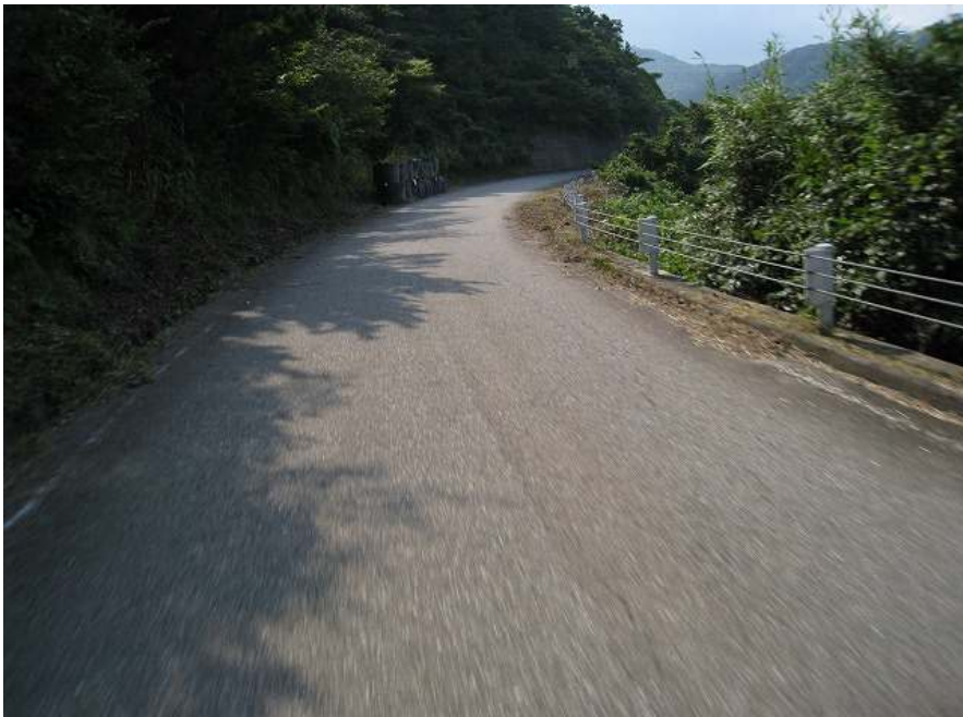
28. 下り その1