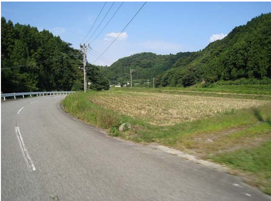
52. 川沿い その6 スーパー農道が見えてきた