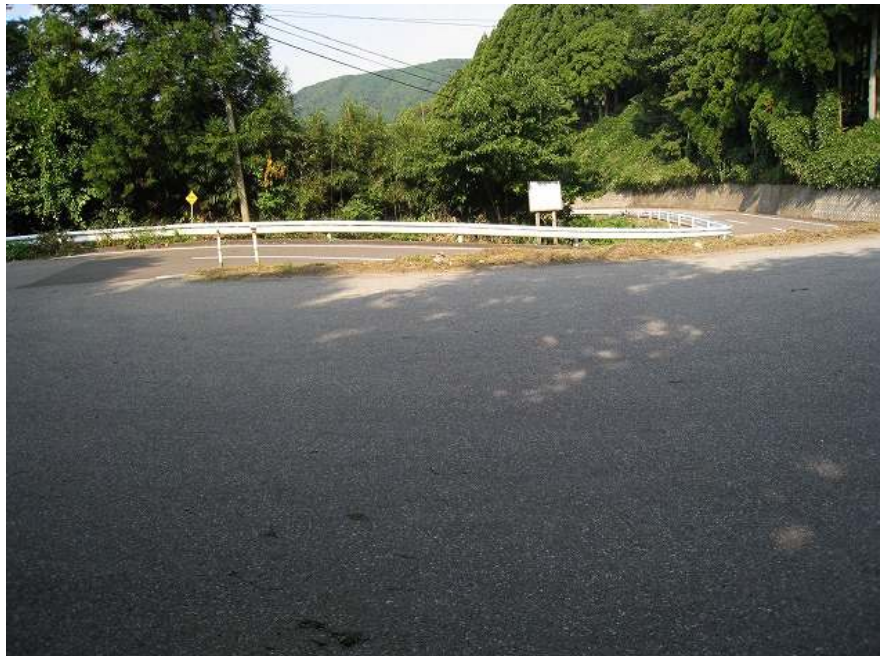
36. ポイント！ 小滝ヘアピンカーブ 横から