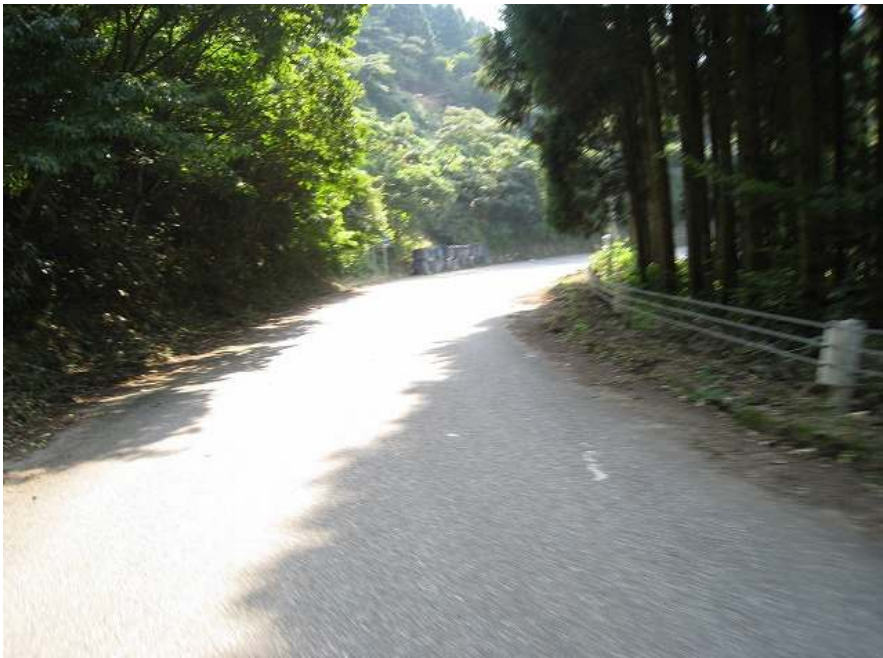
34. 下り その7 小滝のヘアピンはもうすぐ