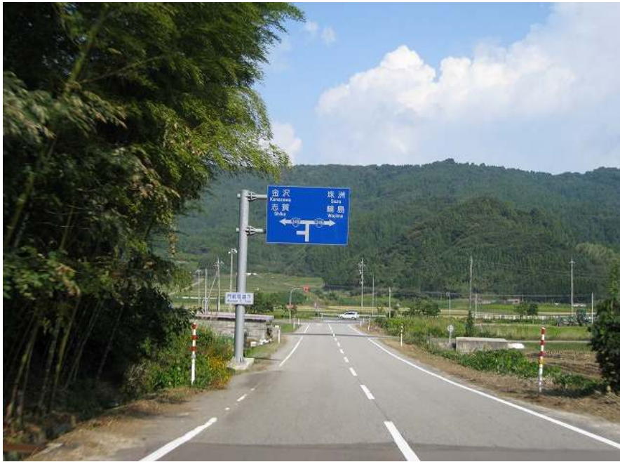
71. スーパー農道 その17 国道交差点が見えてきた 手前300mは追い越し禁止区間