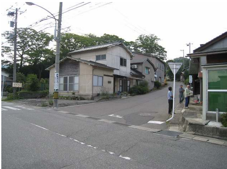
78. 館上り口 右カーブで再び上りへ