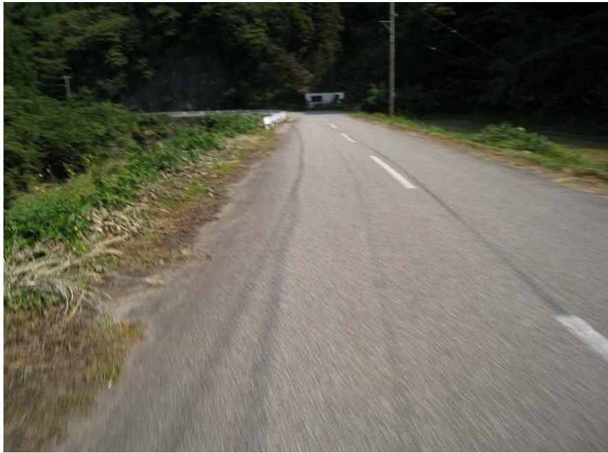
47. 川沿い その1