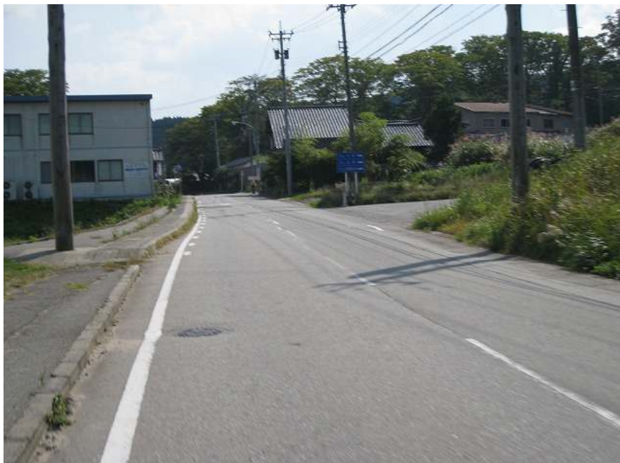
77. 館の上り口はもうすぐ