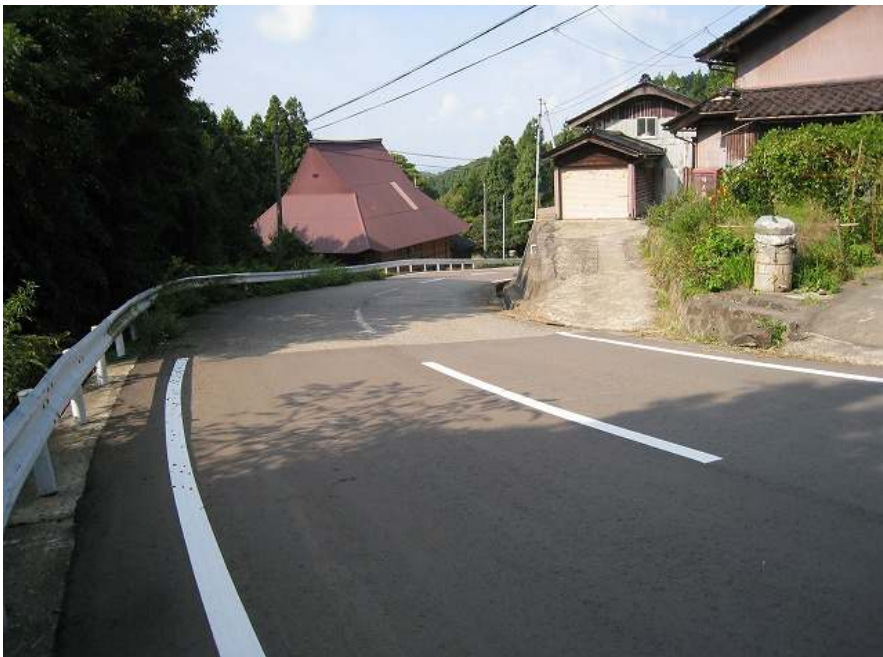
40. 下り その10