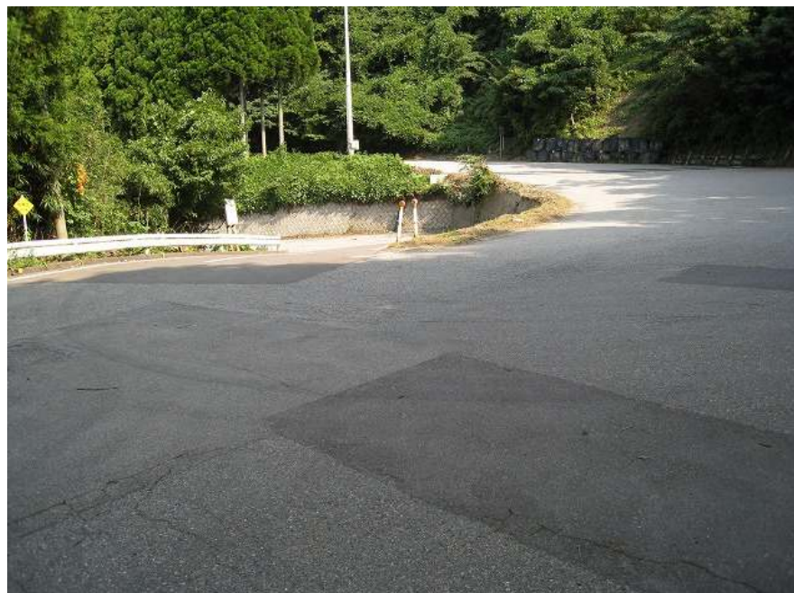
37. ポイント！ 小滝ヘアピンカーブ 出口方面