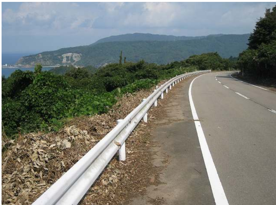
65. スーパー農道 その11 緩やかな右カーブ