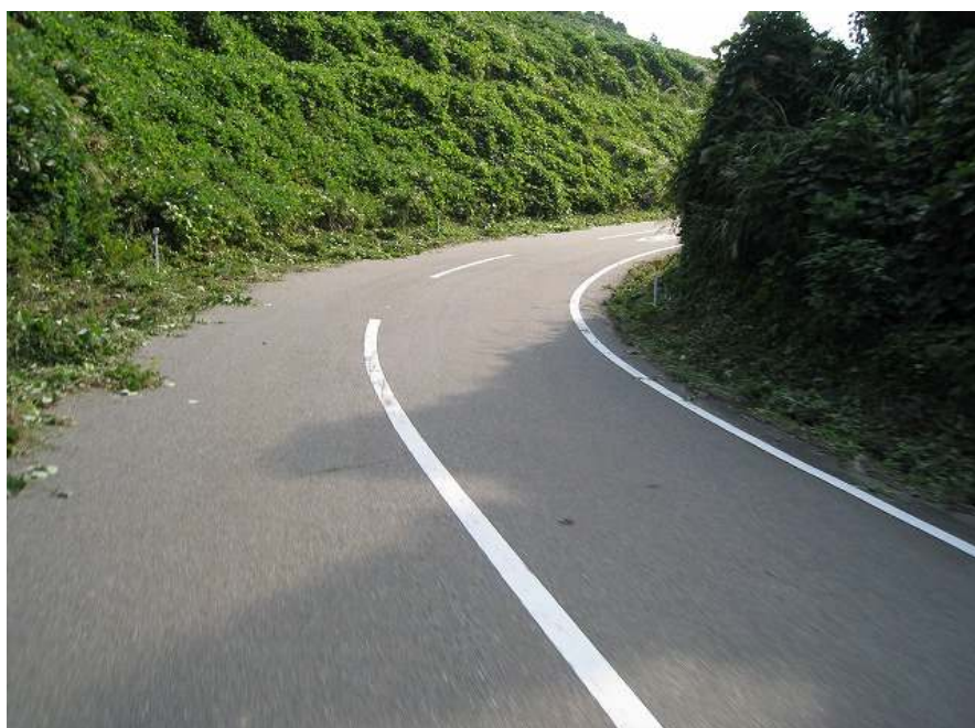
57. スーパー農道 その3