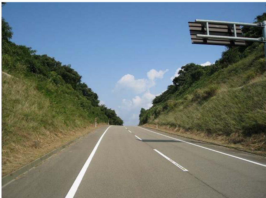
64. スーパー農道 その10 標高132m