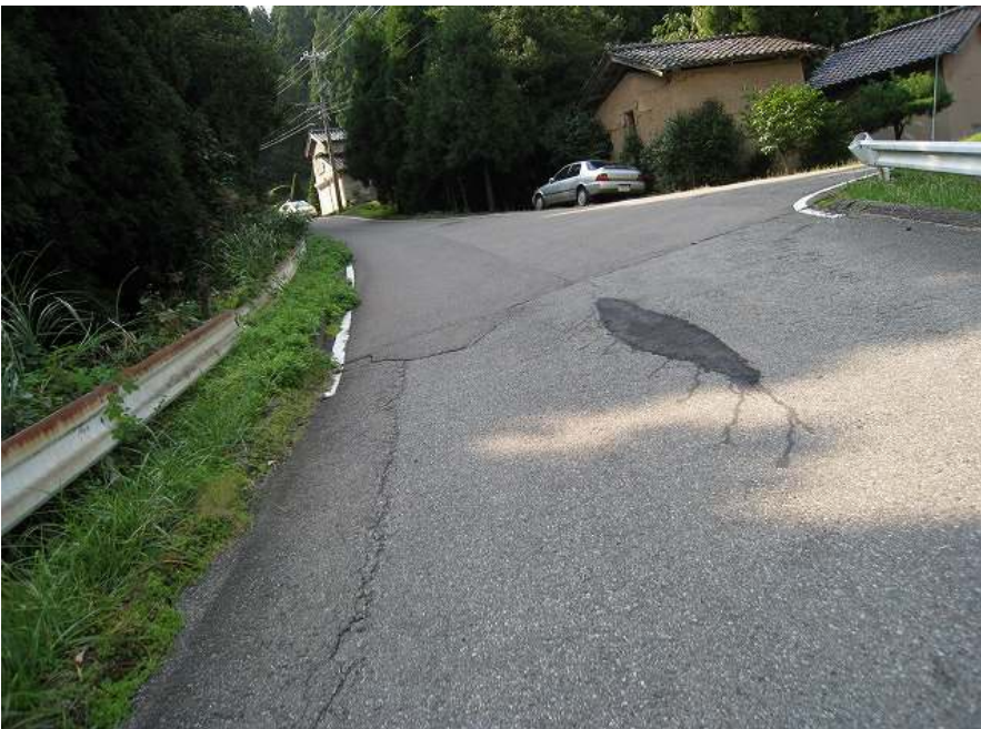
18. 上り その14 勾配めっちゃきつい