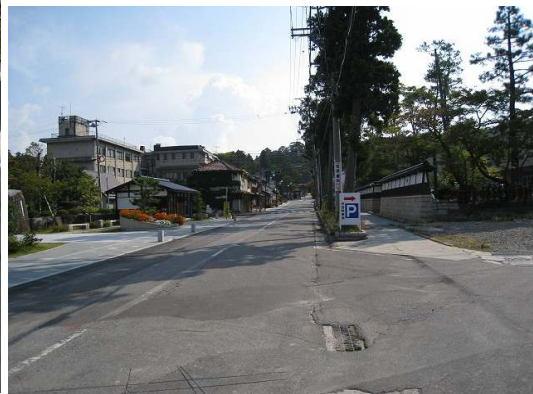
スタート地点から総持寺方面