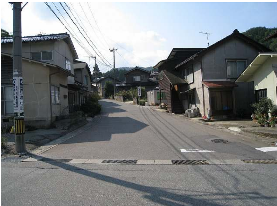
3. 館の上り口 左カーブで上りへ 標高19m