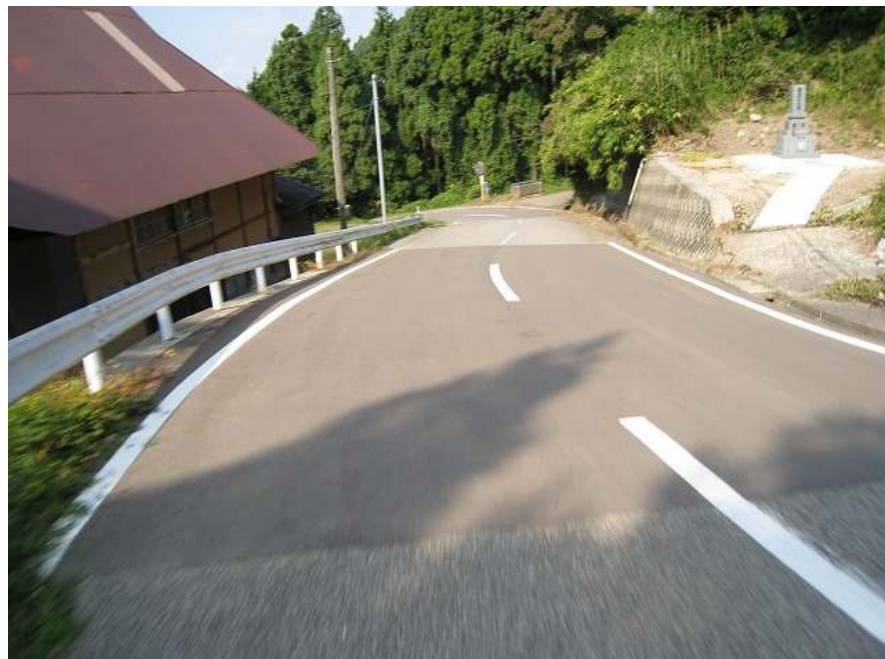
41. 下り その11